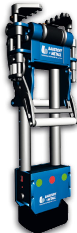
B+M Cool Racer

Das System besteht durch die hohe Kontaktkraft zwischen den wasserbefördernden Kunststoffrohren, dem Profil und der Deckenplatte. Die Übertragungsfläche zwischen Rohr und Profil beträgt etwa 70 % – ein Wert, der durch den Direktkontakt von Rohr und Gipsplatte noch erhöht wird. Durch eine Direktverschraubung wird darüber hinaus der höchstmögliche Kontakt zwischen Platte und Wärmeleitprofil erzeugt und die Profilleistung kann ungehindert an den Raum übertragen werden. Die Kälte- und Wärmeregulierung ist somit wesentlich besser als bei herkömmlichen Klimatisierungssystemen.