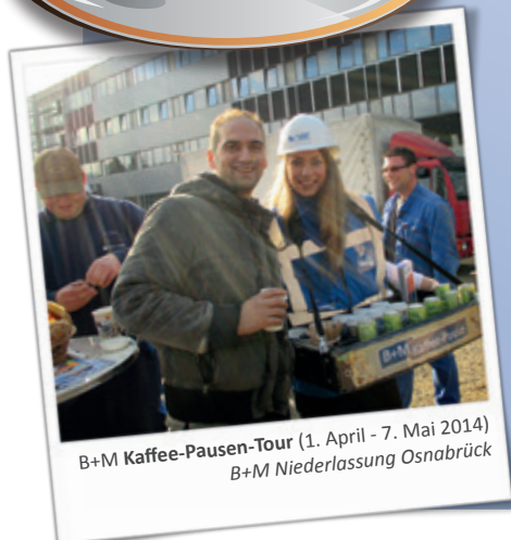
B+M Kaffee-Pausen-Tour (1. April - 7. Mai 2014) B+M Niederlassung Osnabrück