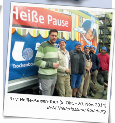
B+M Heiße-Pausen-Tour (9. Okt. - 20. Nov. 2014) B+M Niederlassung Radeburg