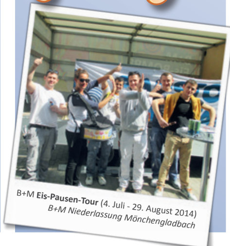
B+M Eis-Pausen-Tour (4. Juli - 29. August 2014) B+M Niederlassung Mönchengladbach