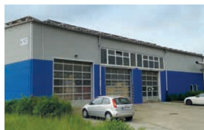
B+M Niederlassung Güstrow