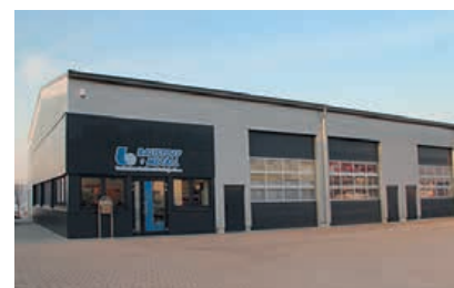
B+M Niederlassung Heiligenstadt

„Heute bestellen, morgen abholen“ – durch die Eröffnung der neuen B+M Standorte in Güstrow und Heiligenstadt wird das jetzt noch einfacher. Bei beiden Filialen handelt es sich um Abhollager. Sie ergänzen die bereits bestehenden Niederlassungen Rostock und Erfurt und sorgen somit für eine noch flächendeckendere Standortverteilung und ein engmaschiges Netzwerk, von dem unsere Kunden profitieren.